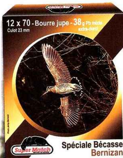
Spéciale Bécasse Bernizan

Efficace et rapide à courte ou moyenne distance. La Bernizan spéciale Bécasse est proposée en cal. 12/70 chargée avec des plombs mixtes n°7,5 et n°10. Elle peut être utilisée dans un canon lisse ou rayé.